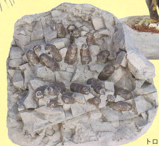
トロオドン生体復元模型