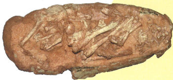
多様な形の卵や巣の化石